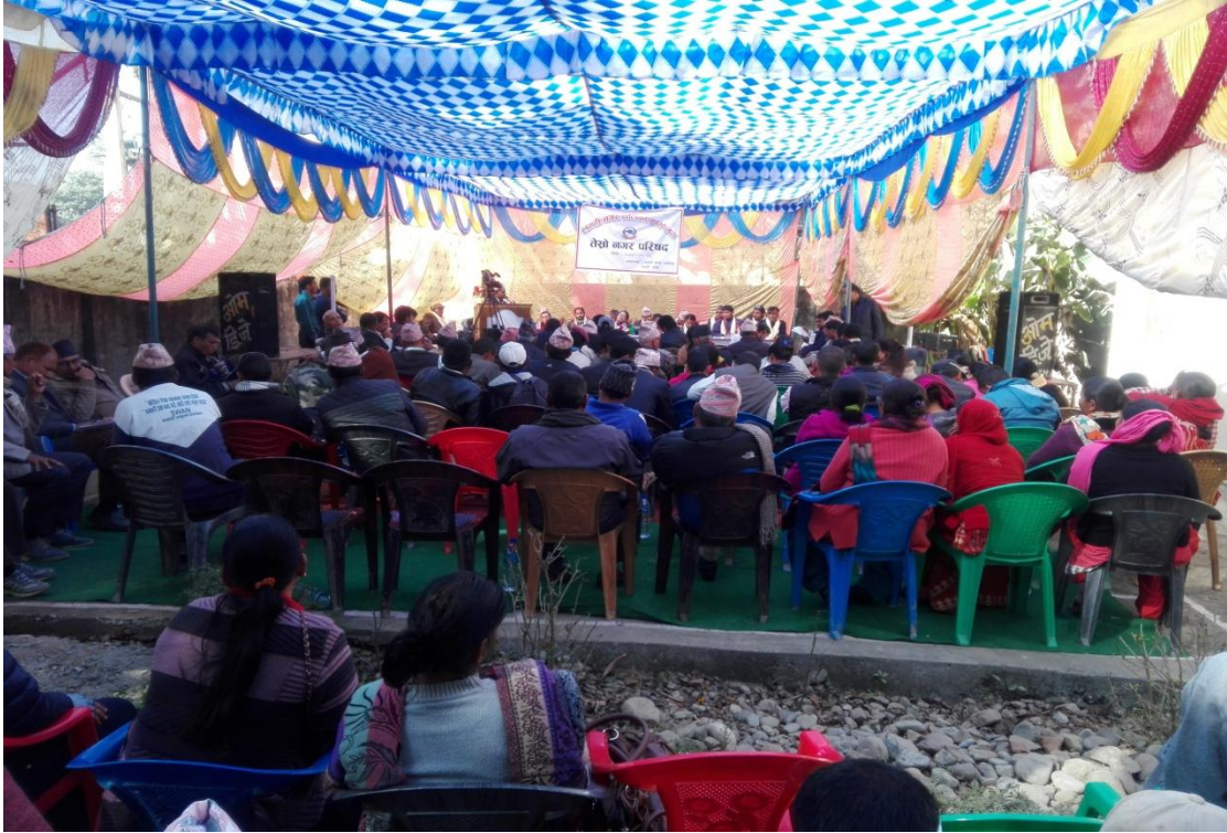
वडा भेलाका तस्बीरहरु